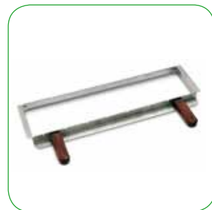
Griglia cuoci arrostiticini Grill for cooking small joints Grill für kleine Fleischspieße Grille de cuisson pour petites brochettes