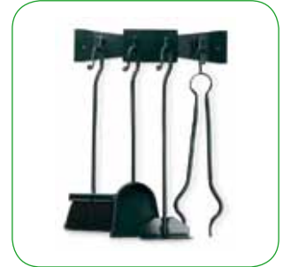
Accessori a parete Wall-mount accessories Grillzubehör mit Wanda hängung Ustensiles à fixer