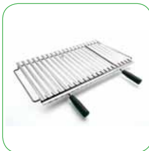
Griglia cottura eco Cooking grill eco Grillrost eco Grille de cuisson eco cm 68x38 - cm 76x38