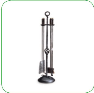
Accessori con piantana Accessories with stand Grillzubehör mit ständer serviteur