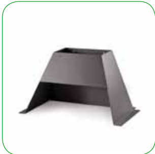
Kit cappa metallica Viking e Thor Viking and Thor metal hood kit Bausatz Metallunterhaube Viking und Thor Kit sous-hotte métallique Viking et Thor