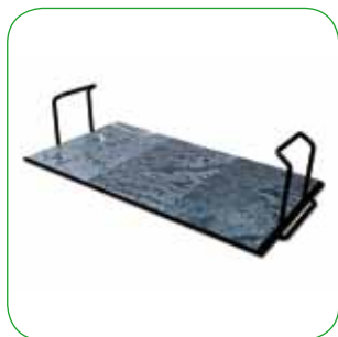
Bioplatt easy Easy Bioplatt Easy Soapstone Bioplatt Bioplatt easy Bioplatt Speckstein easy Bioplatt easy cm 68 - cm 76 - cm 52