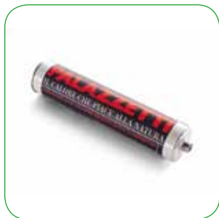
Silicone per montaggio Silicone for assembly Silikon für den Aufbau Silicone pour pose