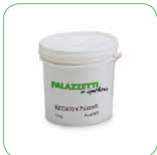
Vaso vernice 10 Kg 10 Kg pot of paint Eimer mit Lack, Inhalt 10 Kg Pot de peinture 10 Kg