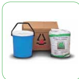
Kit montaggio Assembly kit Montagebausatz Kit de montage