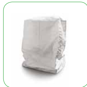
Griglia cottura eco Cooking grill eco grillrost eco Grille de cuisson eco cm 68x38 - cm 76x38