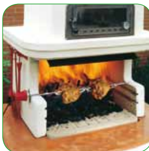
Girarrosto Electric spit Bratspiess Tournebroche cm 76 - cm 68