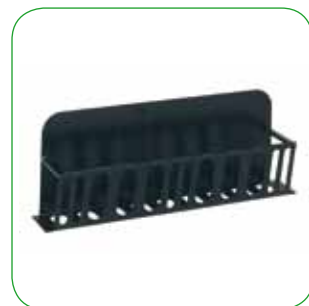
Portalegna Firewood holder Kohlebecken Brasero vertical à bois cm 68 - cm 76