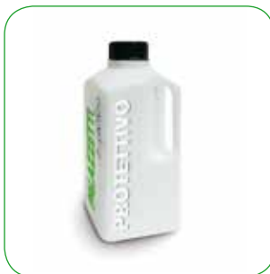
Protettivo liquido per barbecue Water-repellent treatment for barbecues Flüssige Wasserschutzbehandlung für Gartengrillkamine Protection hydrofuge liquide pour barbecue