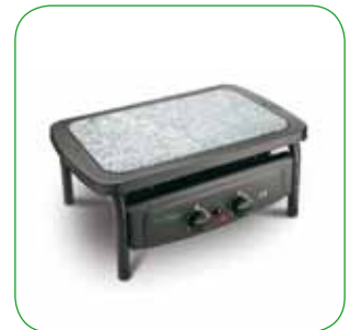
Bioplatt con fornello a gas Bioplatt with gas burner Bioplatt mit Gaskocher Bioplatt avec fourneau à gaz