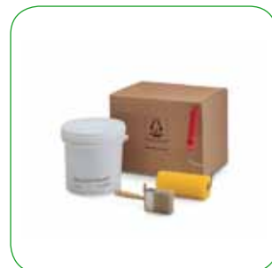
Kit veniciatura Finishing kit Anstreichset Kit peinture