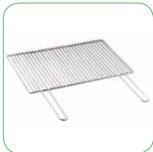
Griglia in acciaio inox Stainless steel cooking grill Grillrost aus edelstahl Grille de cuisson en acier inox cm 52,5x40 - cm 68x40 - cm 76x43