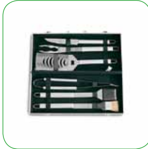
Accessori cucina in acciaio inox Kitchen utensils with stainless steel handle Grillbesteck aus Edelstahl Ustensiles de cuisine en acier inox